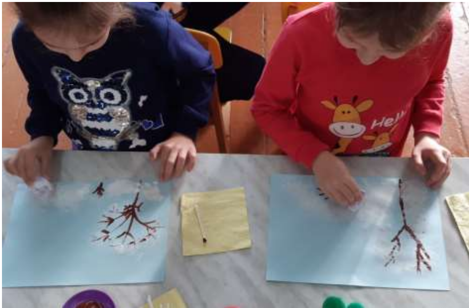
(дети рисуют сугробы мятой бумагой , техника «оттиск мятой бумагой» )