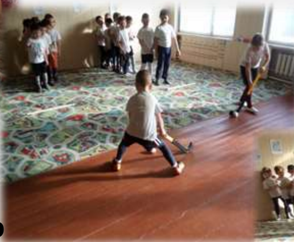
«Хоккей со снежком»