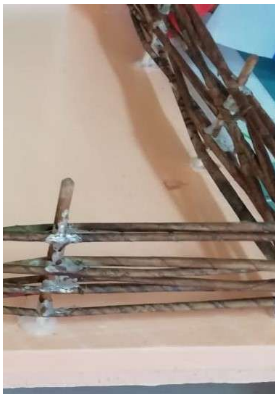
Изготовление хаты из картона и джутового шпагата.